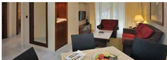
Номер в бунгало с 1 спальней

Максимальное размещение в номере: Размещение для двоих, для троих и индивидуальное размещение в двухместном номере (+18 лет). Во всех типах номеров – 2 взрослых + 1 взрослый. Устанавливается только одна дополнительная кровать в номер (кроме номеров полулюкс, где установка дополнительной кровати не предусмотрена).