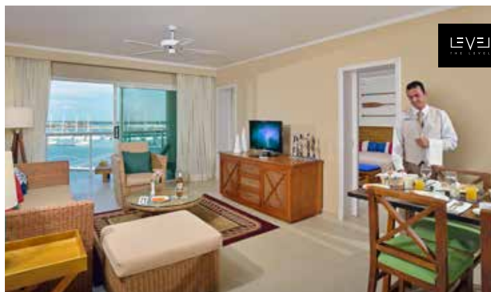
Гранд-люкс The Level с видом на пристань