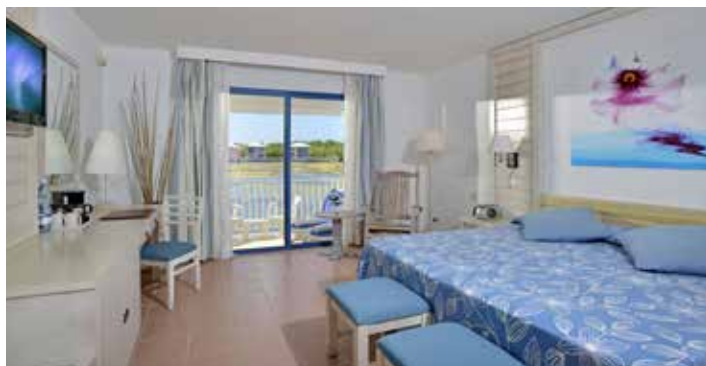
Гранд-премиум с видом на лагуну

Максимальное размещение в номере: Размещение двухместное и двойное индивидуальное. Во всех типах номеров: 3 взрослых. Устанавливается только одна дополнительная кровать в номер (по запросу).