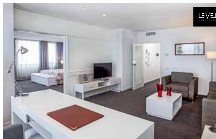
Мастер-люкс The Level

Максимальное размещение в номере: Размещение двухместное и двойное индивидуальное. Во всех типах номеров возможно размещение только 3 взрослых или 2 взрослых + 2 детей (0-12 лет), которые будут делить комнату с 2 взрослыми, кроме номеров полулюкс. Устанавливается только одна дополнительная кровать или детская кроватка в номер (по запросу), кроме номеров полулюкс. Максимальное размещение во всех типах номеров: 2 взрослых + 2 ребенка (кроме номеров полулюкс).