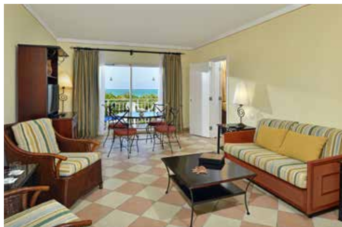
Королевский люкс с видом на море