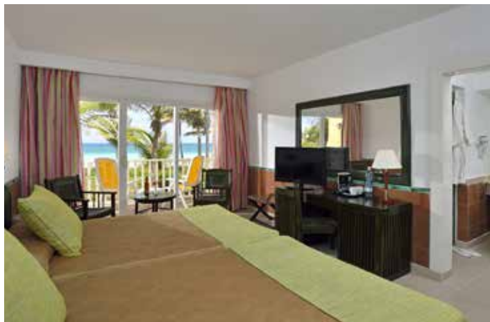
Номер повышенной комфортности с видом на море

Максимальное размещение в номере: Размещение двухместное и двойное индивидуальное. Для всех номеров: 2 взрослых + 2 ребенка (0-12 лет). Разрешается только одна дополнительная кровать или детская кроватка в номер (по запросу).